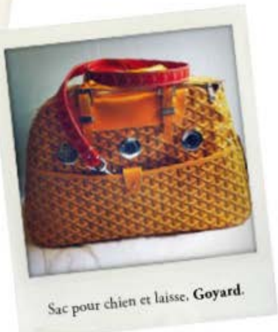
Sac pour chien et laisse, Goyard .