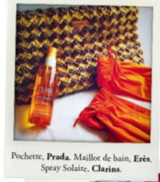
Pochette, Prada . Maillot de bain, Erès . Spray Solaire, Clarins .