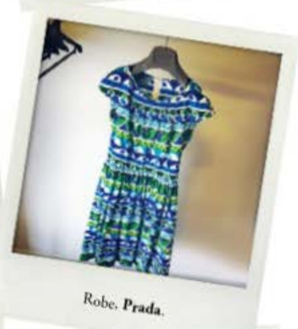
Robe, Prada .