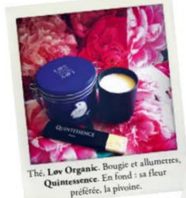
Thé, Lov Organic . Bougie et allumettes, Quintessence . En fond : sa fleur préférée, la pivoine.