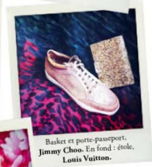
Basket et porte-passeport, Jimmy Choo . En fond : étoile, Louis Vuitton .