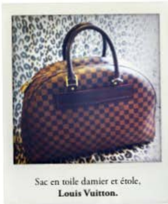
Sac en toile damier et étoile, Louis Vuitton .