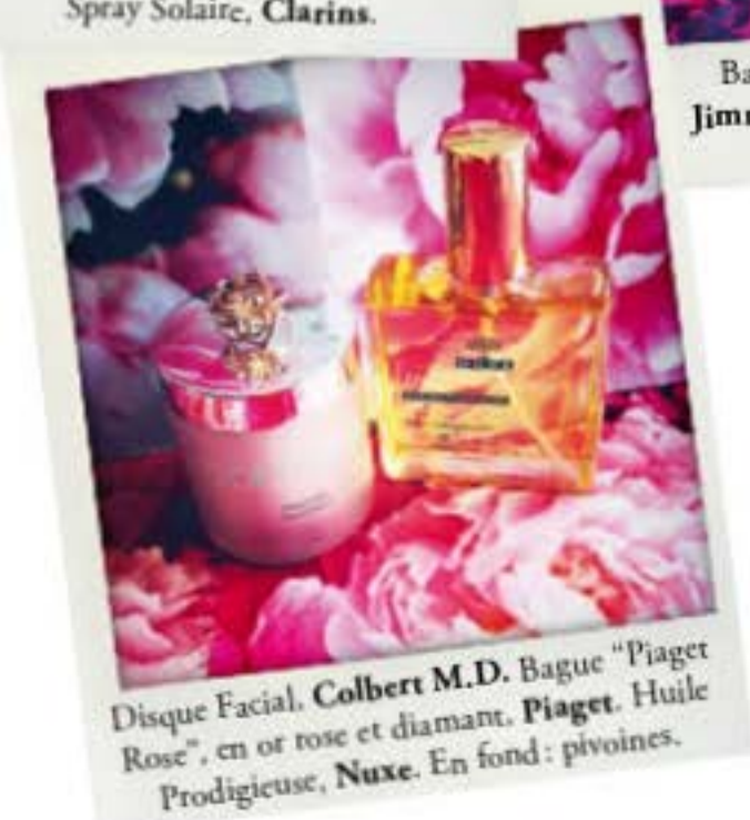
Disque Facial, Colbert M.D. Bague "Piaget Rose", en or rose et diamant, Piaget . Huile Prodigieuse, Nuxe . En fond : pivoines.